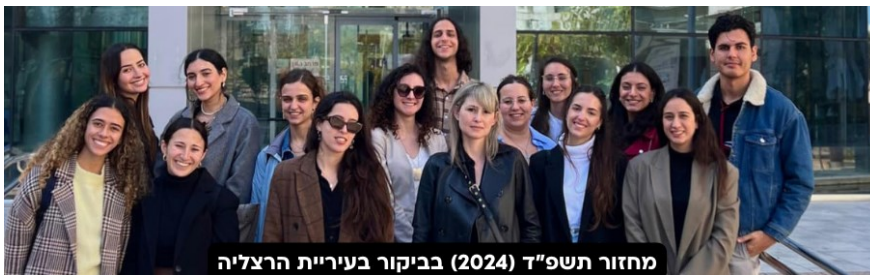
מחזור תשפ"ד (2024) בביקור בעיריית הרצליה

סטודנטים שיתקבלו לסדנה ישתתפו בסמינר הכנה (ריטריט) בן יומיים (כולל לינה) שיתקיים טרם תחילת שנת הלימודים האקדמית. במהלכו יעברו המשתתפים סדנאות, הרצאות העשרה ופעילויות חברתיות, וייקבע בתהליך משותף נושא החקר שהסדנה תקדם בשנת הלימודים תשפ"ה.