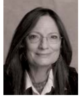
שיפוט וקבלת החלטות

משנה לנשיא לעניינים אקדמיים ראשת תוכנית MBA in Healthcare Innovation, Ph.D., אוניברסיטת תל-אביב ראש תחום שיפוט וקבלת החלטות בבית ספר אריסון למנהל עסקים, המרכזת את לימודי המתמטיקה והסטטיסטיקה באוניברסיטת רייכמן. כתבה ספר בתחום קבלת החלטות, ביחד עם פרופ' עמוס טברסקי ז"ל בשם "חשיבה ביקורתית". חוקרת אורחת באוניברסיטת סטנפורד.