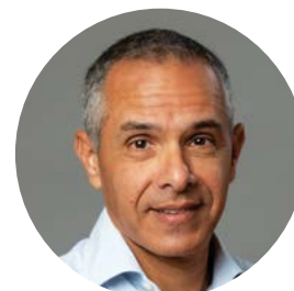
פרופ' ניראון חשאי דיקן בית ספר אריסון למנהל עסקים וראש תוכנית ה-MBA באסטרטגיה ופיתוח עסקי