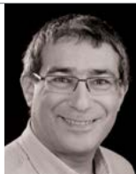
שיווק ורשתות חברתיות

כיהן כחבר סגל בפקולטה לניהול באוניברסיטת תל-אביב ואף זכה בפרס המרצה המצטיין של הפקולטה. שימש כפרופסור אורח בבית הספר למנהל עסקים של MIT. מחקריו עוסקים בהערכת התוצאות השיווקיות של תקשורת "פה-לאוזן" בין צרכנים, התפתחות שווקים למוצרים חדשים והערכת שווי של לקוחות. מחקריו אלה זכו במספר פרסים בינלאומיים.