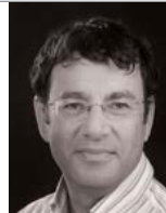
שיווק ורשתות חברתיות

מרצה אורח בבית הספר למנהל עסקים באוניברסיטת קולומביה. מומחה ליצירתיות, פיתוח מוצרים חדשים, הפצת חידושים, מורכבות בדינמיקות שוק והשפעות של רשתות חברתיות. עבודותיו המדעיות פורסמו בכתבי עת מובילים בעולם והוא מחברם של שני ספרים בהוצאת קיימברידג' מייסד ושותף בחברת SIT.