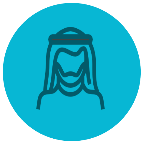
ראשי הקהילה הערבית

דיאלוג מתמיד ושוטף כדי להגיע להבנות והסכמות