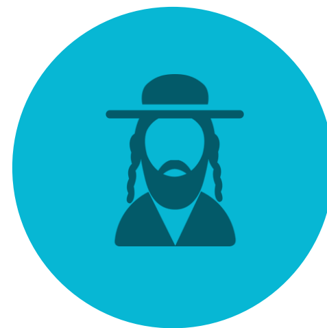
ראשי הקהילה החרדית